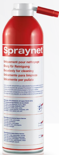
SPRAYNET 500 ml spray de limpeza Embalagem de 6 unidades REF. 1600036-006