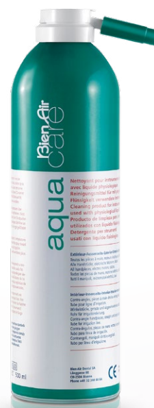
AQUACARE 500 ml spray de limpeza Embalagem de 6 unidades REF. 1600617-006