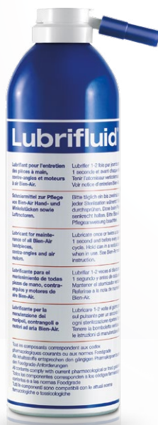
LUBRIFLUID 500 ml lubrificante Embalagem de 6 unidades REF. 1600064-006