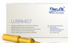
LUBRIMED Embalagem de 6 aplicadores REF. 1600037-006