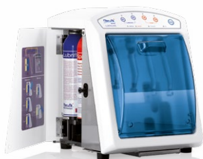
LUBRICARE Sistema de manutenção REF. 1600915-001